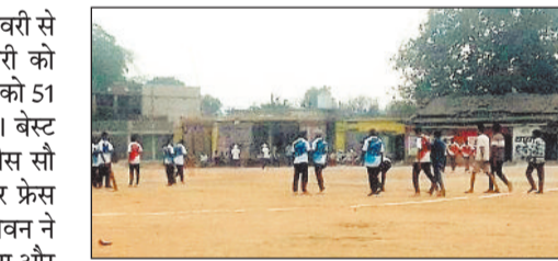
लिए अच्छी रणनीति अपनाते हुए अपना जीत हासिल करने के लिए 4 विकेट गवाकर 3 बाल शेष रहते हुए मैच फ्रेंस इलेवन ने 103 का टारगेट पूरा कर लिया।

लोड़ंग। पूर्वांचल के ग्राम पंचायत लोड़ंग में 1 फरवरी से रोजाना तीन टीम का मैच चल रहा है। फरवरी को फाइनल मैच खेला जाएगा। इस मैच के विजेता को 51 और सेकंड विजेता को 31 हजार दिया जाएगा। बेस्ट बेट्समैन को 3100 तथा बेस्ट बॉलर को इकतीस सौ दिया जाएगा। 5 फरवरी को बबलू इलेवन और फ्रेंस इलेवन के बीच मैच खेला गया। टास बबलू इलेवन ने जीतकर पहले बैटिंग करने के लिए मैदान में उतरा और सात विकेट खो कर 102 बनाकर टारगेट दिया 103 रन का। फ्रेंस इलेवन 103 रन का पीछा करने के लिए दल बल लेकर मैदान पर उतरा और जीत हासिल करने के