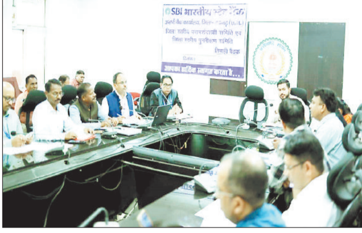
बैंक प्रतिनिधियों का बैठक लेते जिला पंचायत सीईओ।

बैठक में साख.जमा अनुपात, कमजोर वर्गों को ऋण स्वीकृति, महिलाओं, अल्पसंख्यक, अनुसूचित जाति एवं जनजाति वर्ग के लिए बैंकिंग सुविधाओं की समीक्षा की